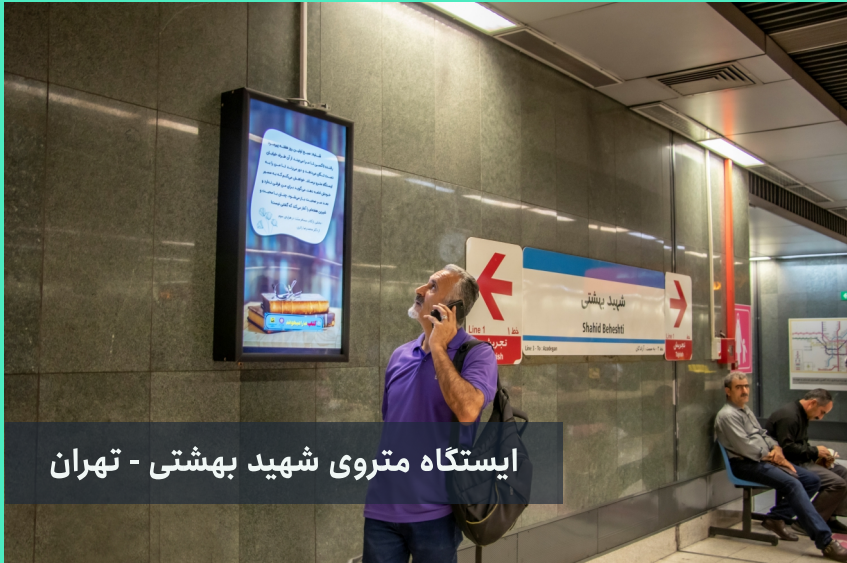
ایستگاه متروی شهید بهشتی - تهران