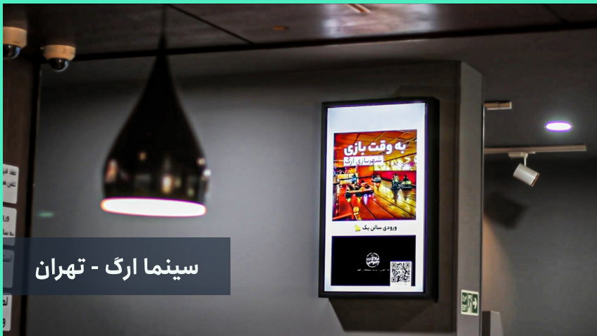
سینما ارگ - تهران